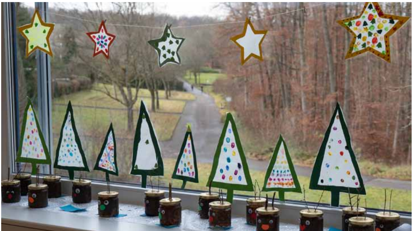
Weihnachtlicher Blick aus einem Klassenzimmer der Roßdorf-Schule - leider ohne Schnee

Fußweg von der Wendepalte an der Grünwaldstraße zum Rubensweg 6 und 8. Am unteren Bildrand rechts mündet dieser Weg in die „Spielstraße“, in der Autos langsam fahren dürfen (Zufahrt zu einigen Reihenhäusern in der Holbeinstraße)