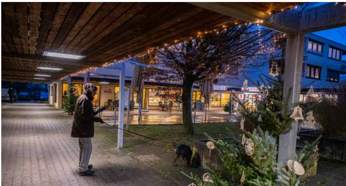
Das Ladenzentrum zur Weihnachtszeit, mit der vom BAR gespendeten neuen Beleuchtung.

BAR und der Bürgerschaft vorstellen. Die Idee, diese Wiese zu bebauen, ist nicht ganz neu. Schon vor ein paar Jahren, als die Stadt bebaubare Flächen im Zusammenhang mit Flüchtlingsunterkünften suchte, war dieses Grundstück im Gespräch gewesen. dh/wow