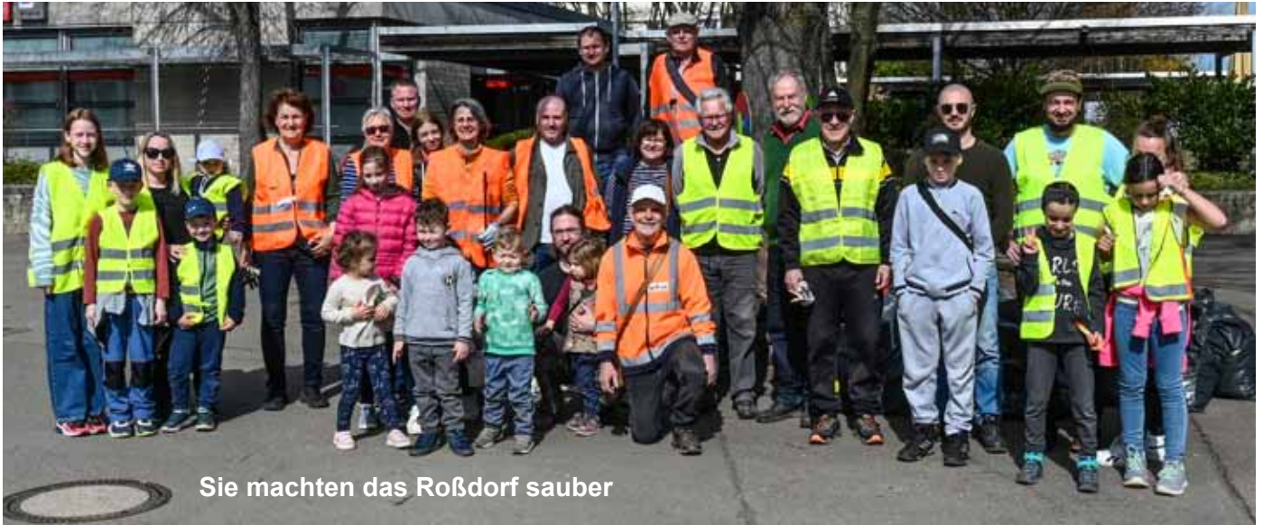
Sie machten das Roßdorf sauber