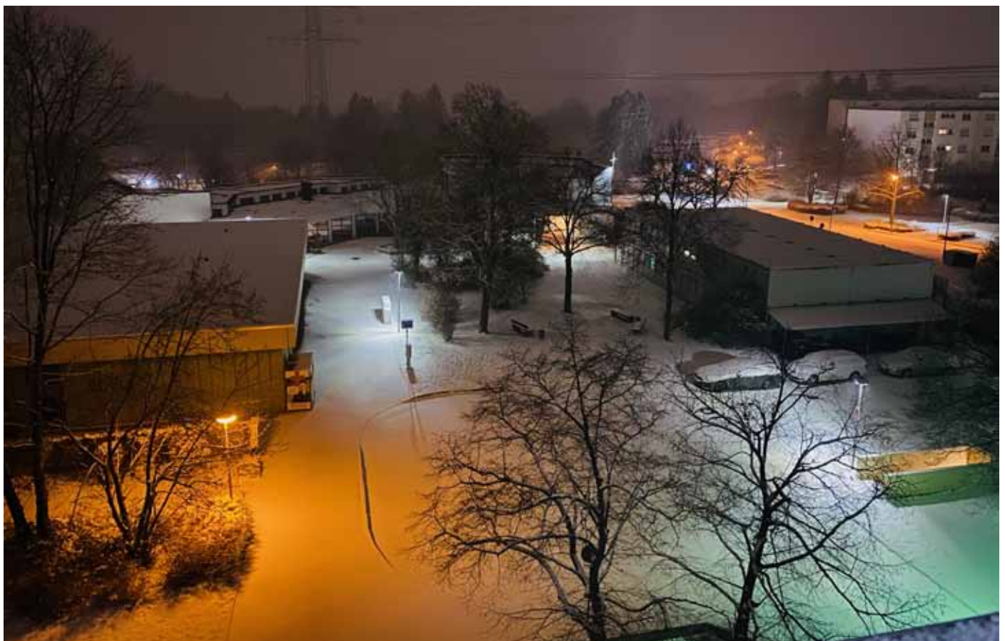
Es gab ihn ja tatsächlich noch, den „Schnee im Roßdorf“. So betitelte Lias Wieden sein Bild, für das er den 1. Preis beim Fotowettbewerb der „Jugendarbeit im Roßdorf“ erhielt. Weitere Bilder auf Seite 4.

Auch das Frisör-Geschäft neben dem Roßdorf-Lädle wird neu gestaltet. Es ist gut für das Ladenzentrum und damit für die Roßdorferinnen und Roßdorfer; wenn das Angebot erweitert wird und Neues hinzukommt. wow