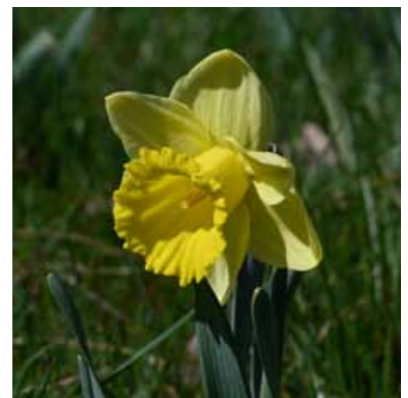
Narzisse, vom BAR gepflanzt