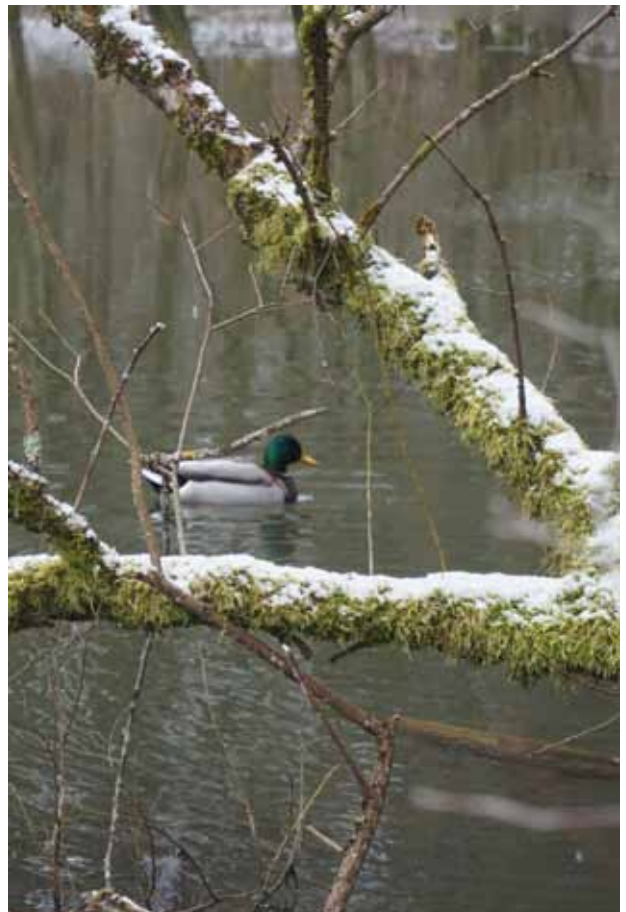
Unten: Diev Ente im winterlichen Waldteich von Leon Kuhn