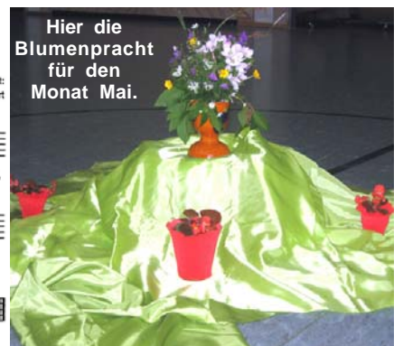
Hier die Blumenpracht für den Monat Mai.