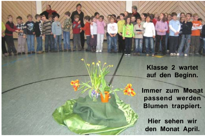
Klasse 2 wartet auf den Beginn.

Bei allen Liedern wirken die Schüler der Roßdorfschule, die bei der Kooperation mit der Musikschule teilnehmen, mit ihren Instrumenten (Geige, Flöte, Schlaginstrument und Keyboard) unter tatkräftiger Unterstützung ihrer Musikschullehrerinnen mit.