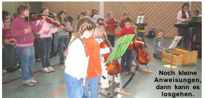
Noch kleine Anweisungen, dann kann es losgehen.