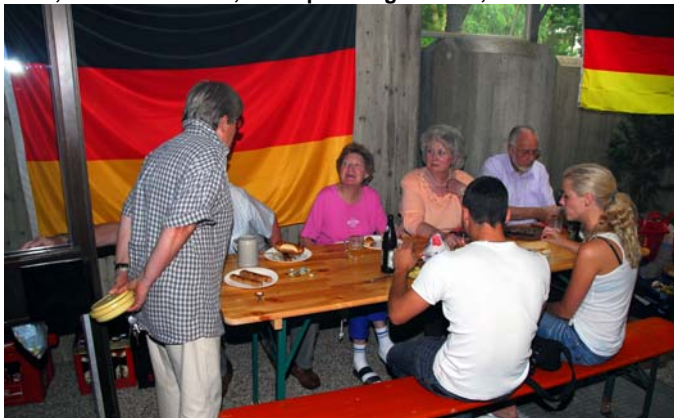
„Kann ich mich zu euch setzen“ ist hier die Frage - ist doch klar!