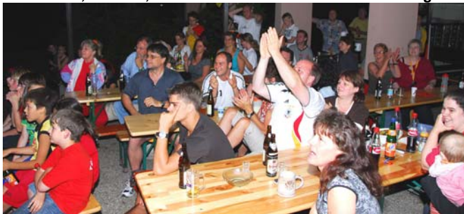
Juhu, endlich ein Tor, die Spannung wächst, die Freude auch.