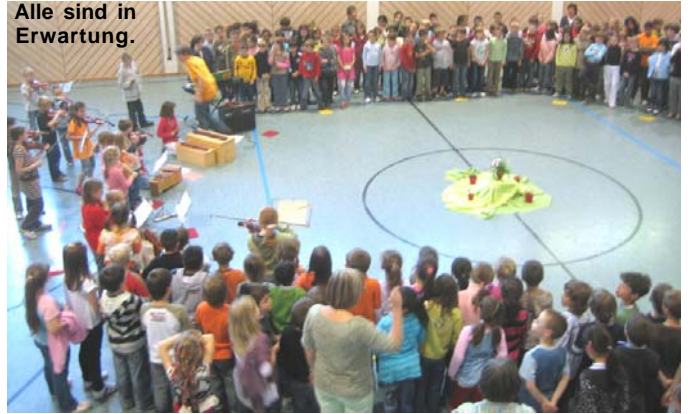
Alle sind in Erwartung.