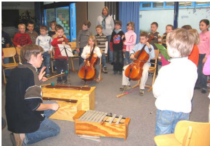
Im Musiksaal der Roßdorfschule wird zuerst fleißig geübt.