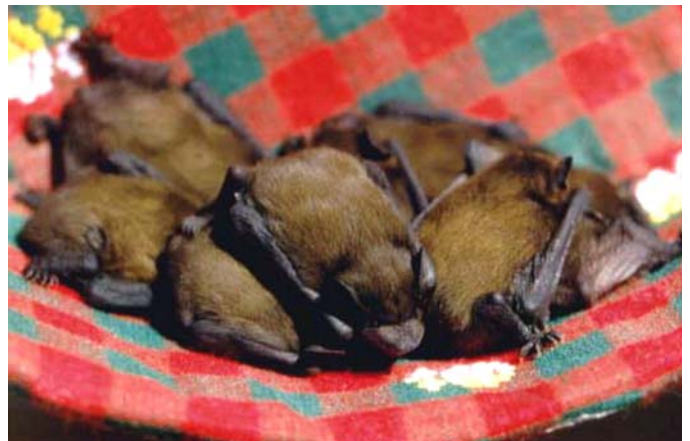
Aus dem Quartier gefallene Zwerg-Fledermaus-Junge.

Bis sie im März erwachen, sich warm zittern und wieder aus der Höhle flattern - einem neuen Jahr und neuen Abenteuern entgegen.