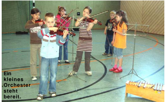
Ein kleines Orchester steht bereit.