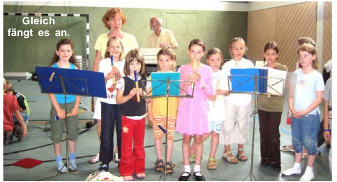
Gleich fängt es an.