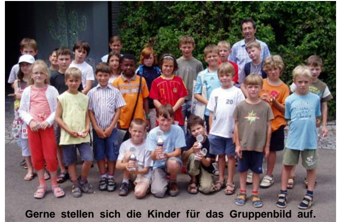
Gerne stellen sich die Kinder für das Gruppenbild auf.