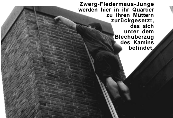
Zwerg-Fledermaus-Junge werden hier in ihr Quartier zu ihren Müttern zurückgesetzt, das sich unter dem Blechüberzug des Kamins befindet.

Noch besser aber wäre es, wenn unsere Wälder „spechtgerechter“ und „abendseglergerechter“ würden, also viele Baumhöhlen aufwiesen. Wir empfehlen vierzig Spechthöhlen-Bäume pro zehn Hektar Wald und ein vielfältiges Mosaik an Lebensräumen, darunter auch Altholzbestände und Totholzinseln. Dies käme nicht nur den Abendseglern, sondern auch vielen anderen Tierarten zugute.